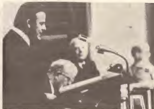
Sr. Betico Croes, como miembro di Staten, ta defende e causa di Aruba, den parlamento Ulandes (September 1978).